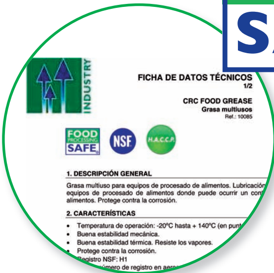
Ficha de datos técnicos